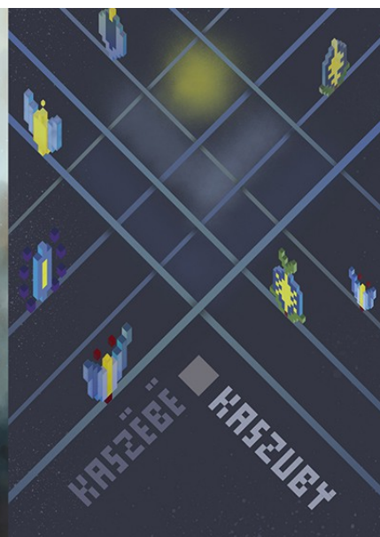
III MIEJSCE - DAMIAN CHRUL GDAŃSK (WOJ. POMORSKIE)